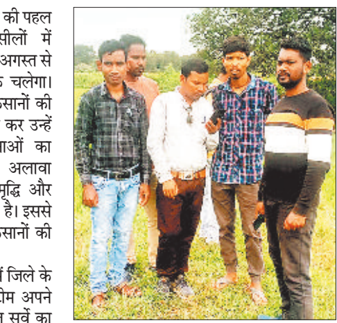
फसल की सर्वे करते पटवारी।

दुर्ज करना होता है। साथ में फोटो अपलोड करना होता है जिसके सत्यापन बाद में पटवारी एवं वरिष्ठ अधिकारियों के द्वारा किया जाएगा। इससे फसल