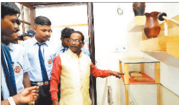
संग्रहालय में रखी वस्तुओं की जानकारी प्राप्त करते बच्चे।